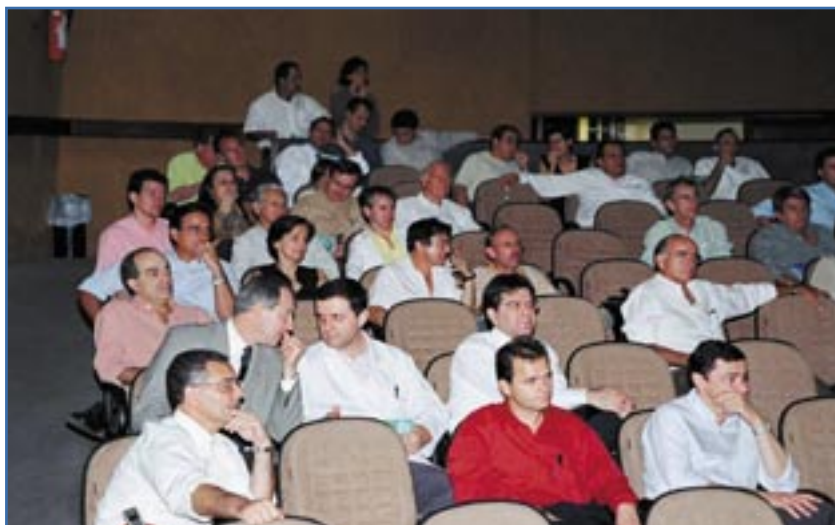
O encontro em Brasília, realizado no Hospital das Forças Armadas (HFA), reuniu cerca de 70 médicos

As variações, dentro das bandas determinadas nacionalmente, serão decididas pelas Comissões Estaduais ou Regionais de Honorários Médicos, levando-se em conta as peculiaridades regionais.