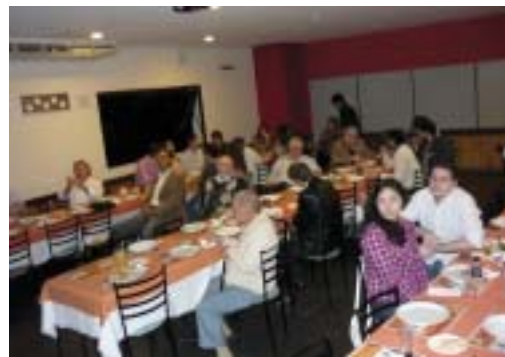
Dia 6 de junho