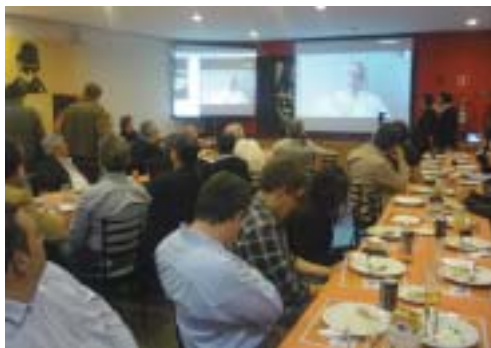
Dia 9 de maio

Nos dias 9 de maio, 6 de junho, 4 de julho e 1 de agosto de 2013 aconteceram as tradicionais Pizzas Cirúrgicas. Como sempre, as reuniões das Pizzas Cirúrgicas têm um grande número de participantes e são muito disputadas. Nestas últimas quatro edições mantivemos a transmissão via internet com participação ativa dos demais colegas internautas. Isto tem proporcionado, de forma crescente, a maior participação e integração dos colegas que não conseguem comparecer a cidade de São Paulo. Nossa intenção é de manter esta prática e procurar ampliar cada vez mais os participantes.