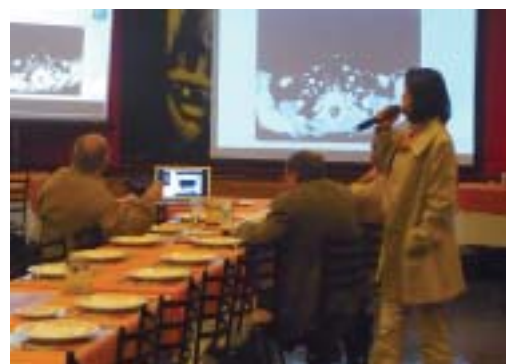
Dia 1 de agosto