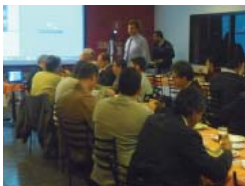
Dia 4 de julho