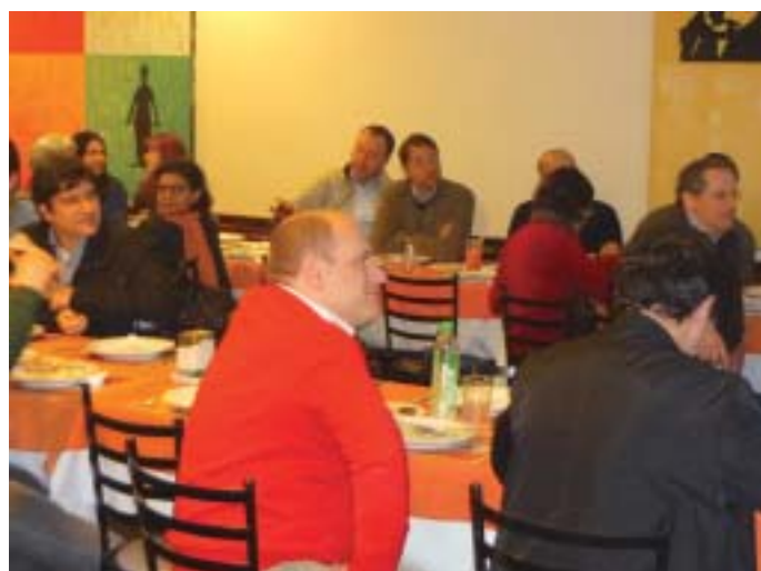
Dia 15 de agosto